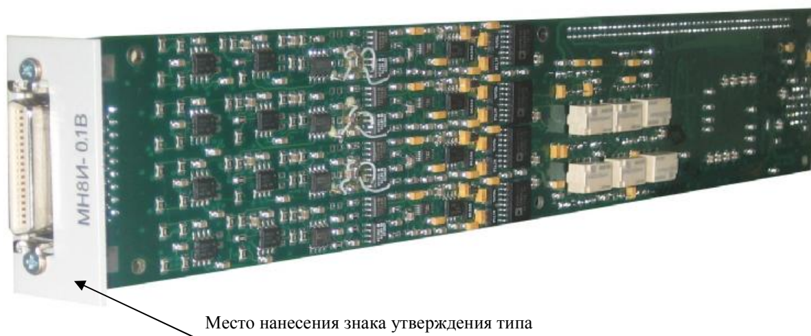
Рисунок 3 - Внешний вид измерителя МН8И-0,1В с указанием места нанесения знака утверждения типа