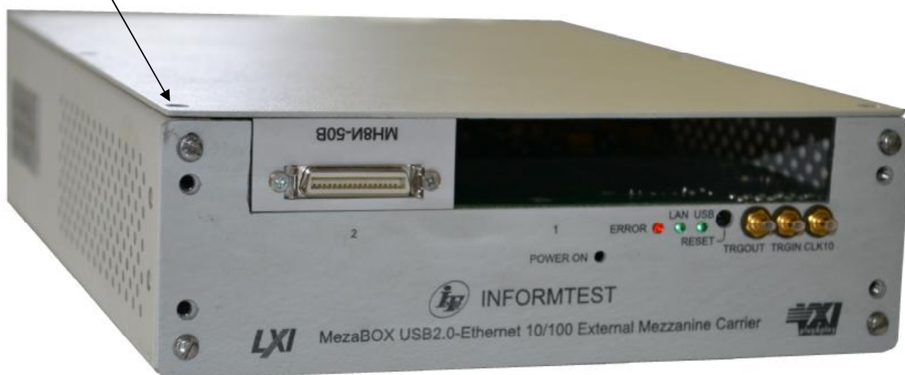
Рисунок 4 - Внешний вид устройства MezaBox ФТКС.469133.006 с установленным измерителем