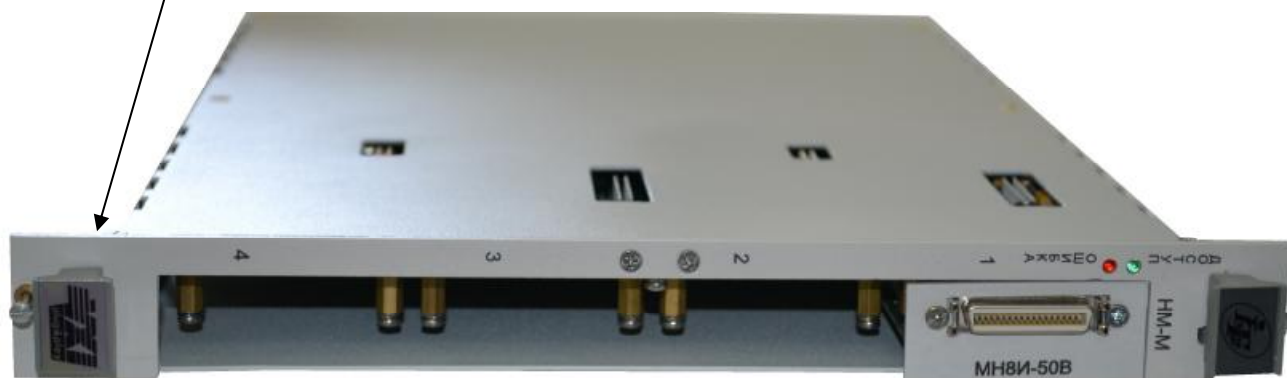
Рисунок 5 - Внешний вид модуля НМ-М ФТКС.468269.011 с установленными измерителями