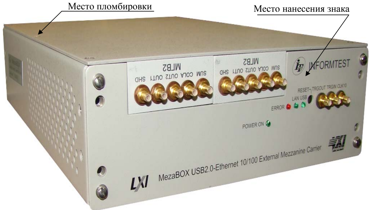
Рисунок 1 – Внешний вид устройства MezaBox с установленными генераторами сигналов, указанием места нанесения знака утверждения типа и местом пломбировки