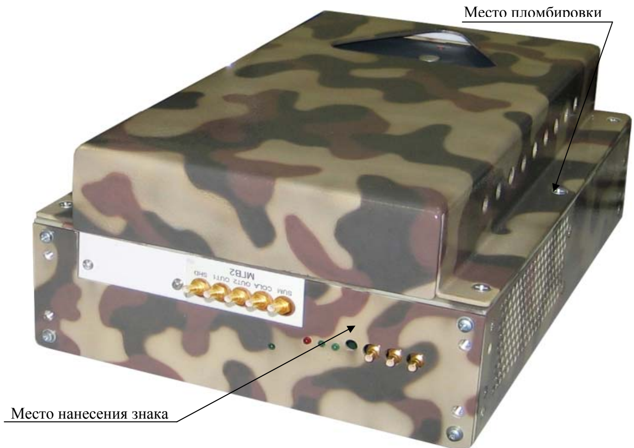
Рисунок 2 – Внешний вид устройства MezaBox Battery 133W-hrs с установленным генератором сигналов, указанием места нанесения знака утверждения типа и местом пломбировки