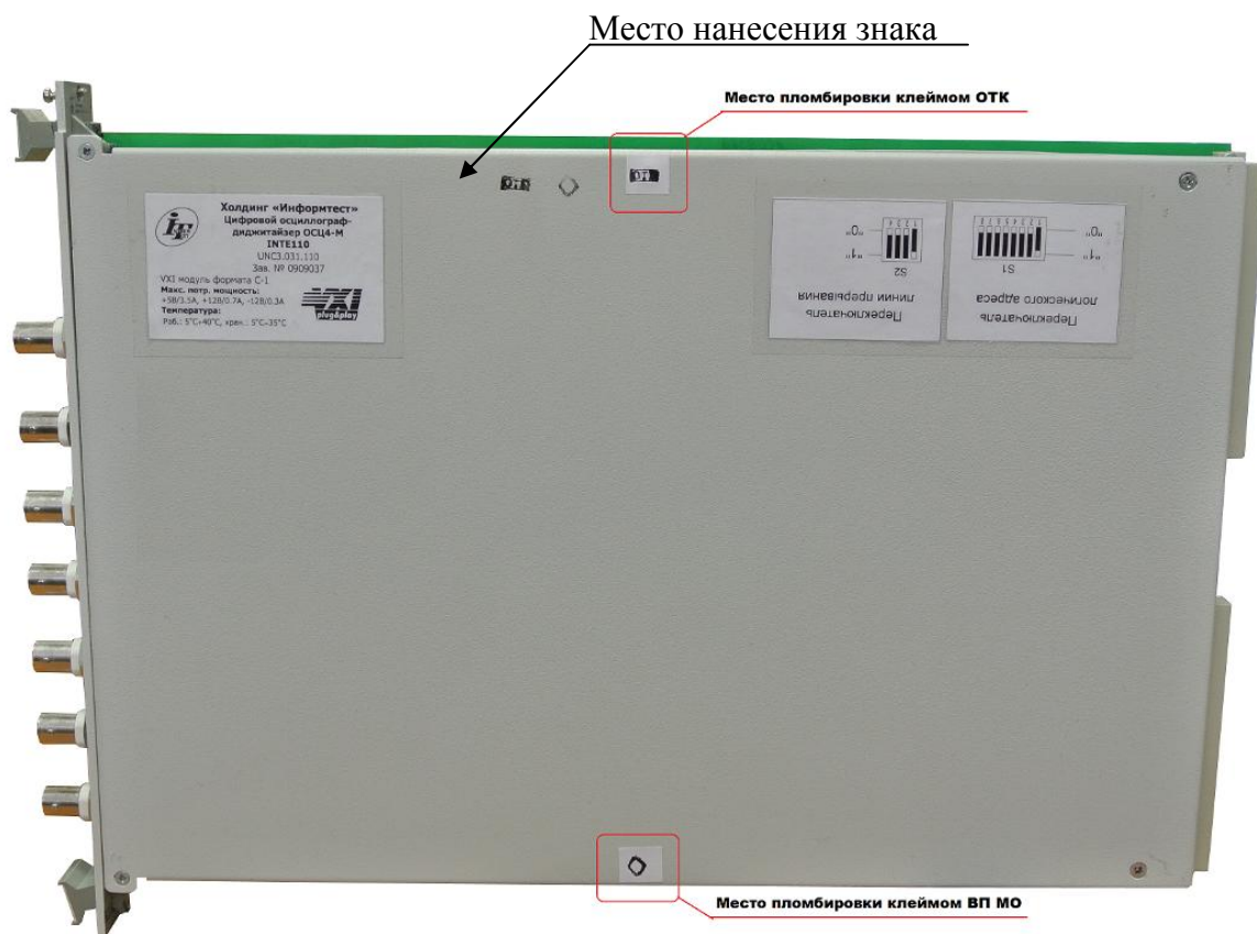
Рисунок 1 – Внешний вид и пломбировка ОСЦ4-М